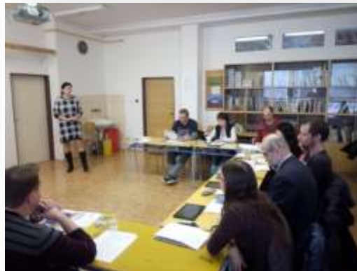
Zeměpisci se seznamují s novými učebnice