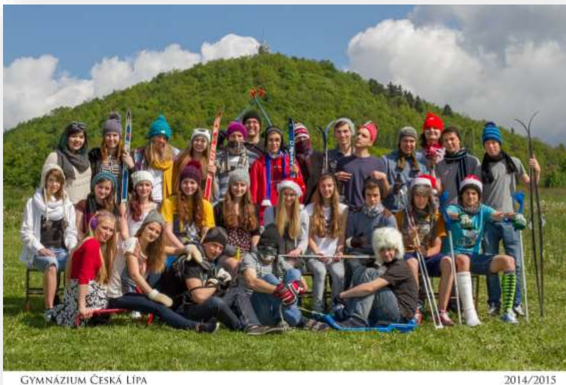
GYMNÁZIUM ČESKÁ LÍPA