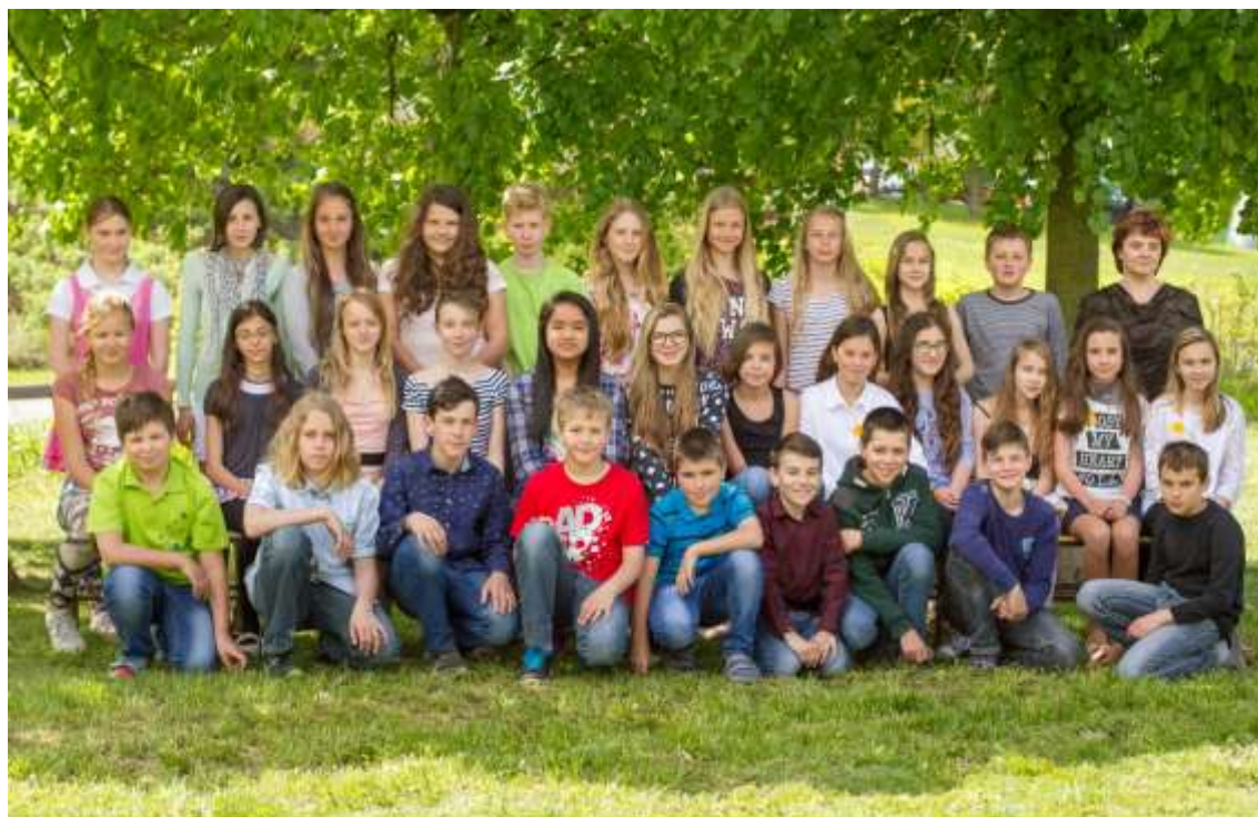
GYMNÁZIUM ČESKÁ LÍPA