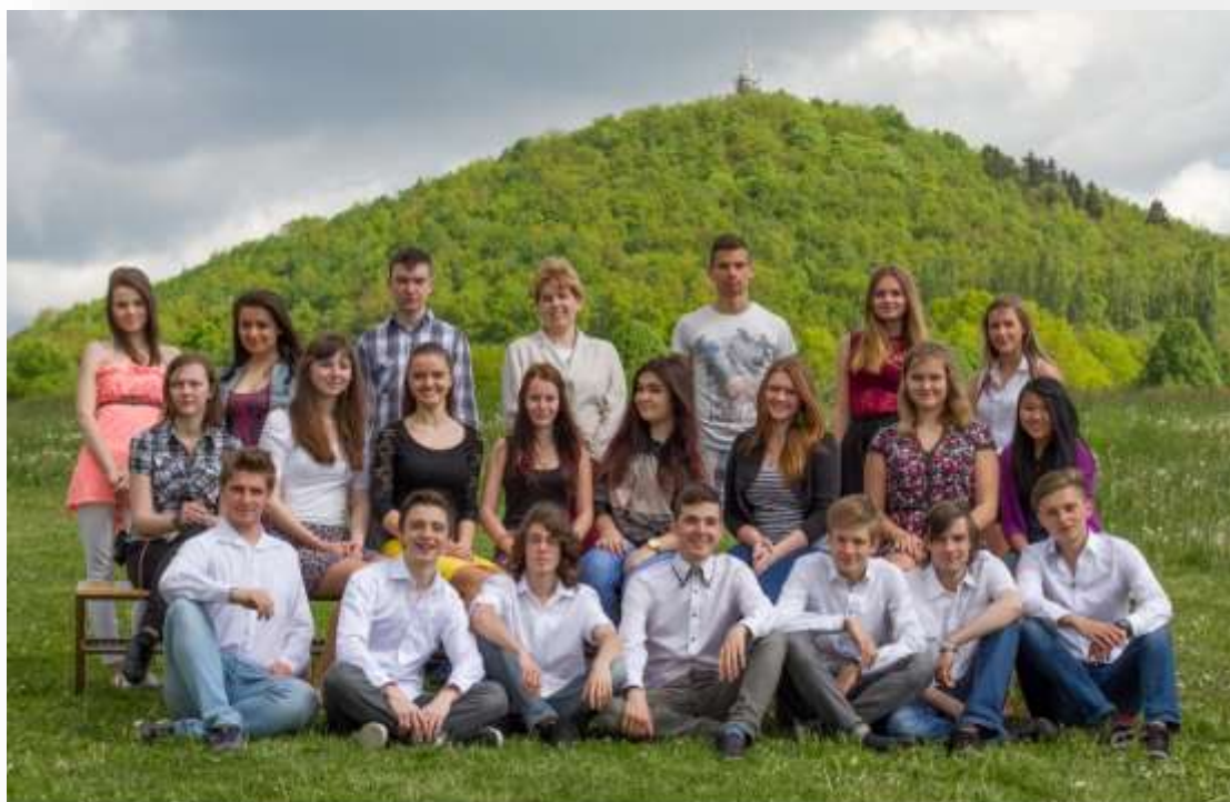
GYMNÁZIUM ČESKÁ LÍPA