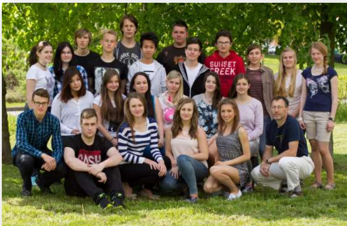
GYMNÁZIUM ČESKÁ LÍPA