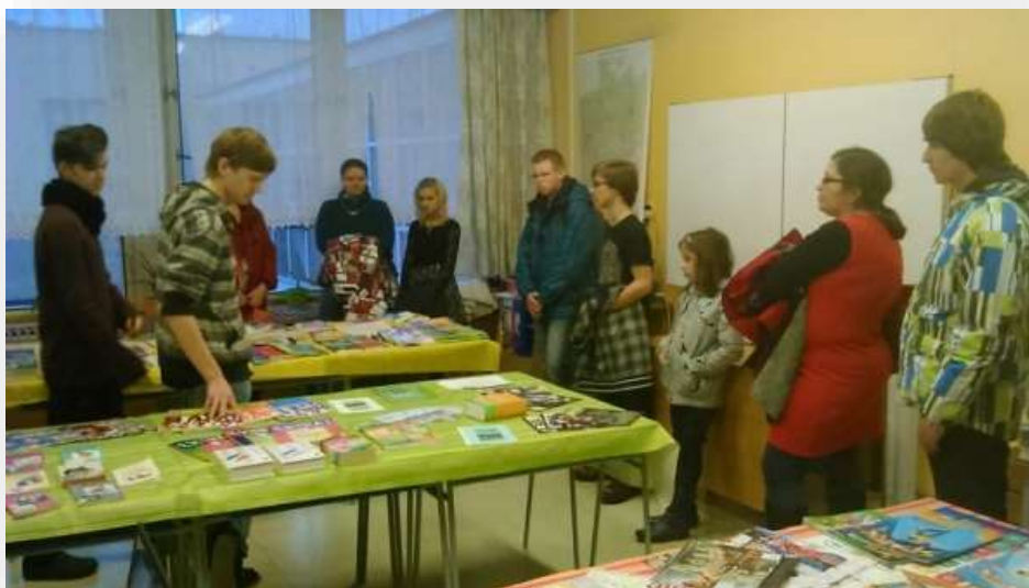
Návštěvníci školy v učebně cizích jazyků.

Atmosféra Dne otevřených dveří byla velmi příjemná a oboustranně vstřícná. Výborní byli především studentští průvodci.