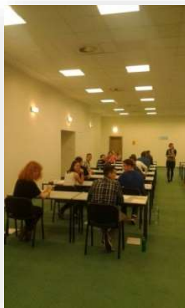
Naši žáci při písemné části zkoušek FCE.