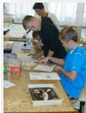
Děti ze základních škol při projektových dnech chemie, fyziky a biologie.

Ve všech klíčových aktivitách se nám podařilo splnit naplánované akce, na závěr projektu byla vypracována evaluační zpráva.