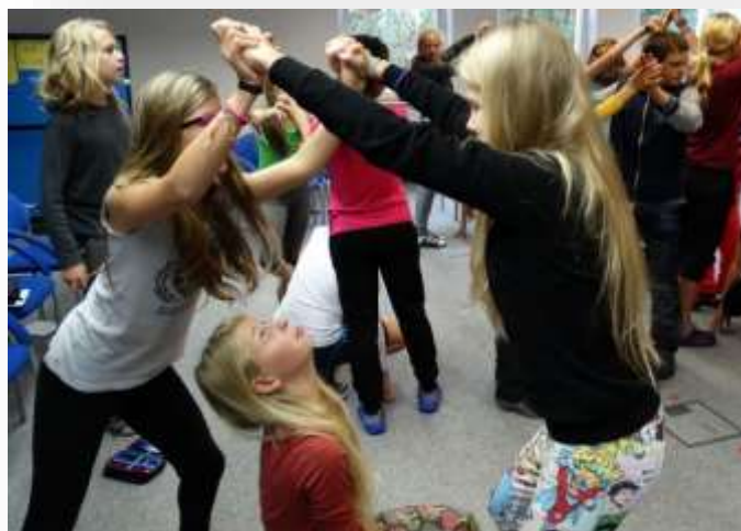
Fotografie z adaptačního, vodáckého a adrenalinového kurzu.