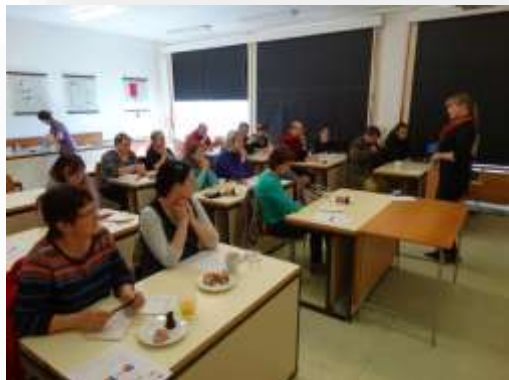
Metodické setkání biologů – duben 2015

9. 4. 2015 – Zajímaví živočichové Českolipska + závěrečné shrnutí a hodnocení MC biologie, 13 účastníků, 10 opakovaně