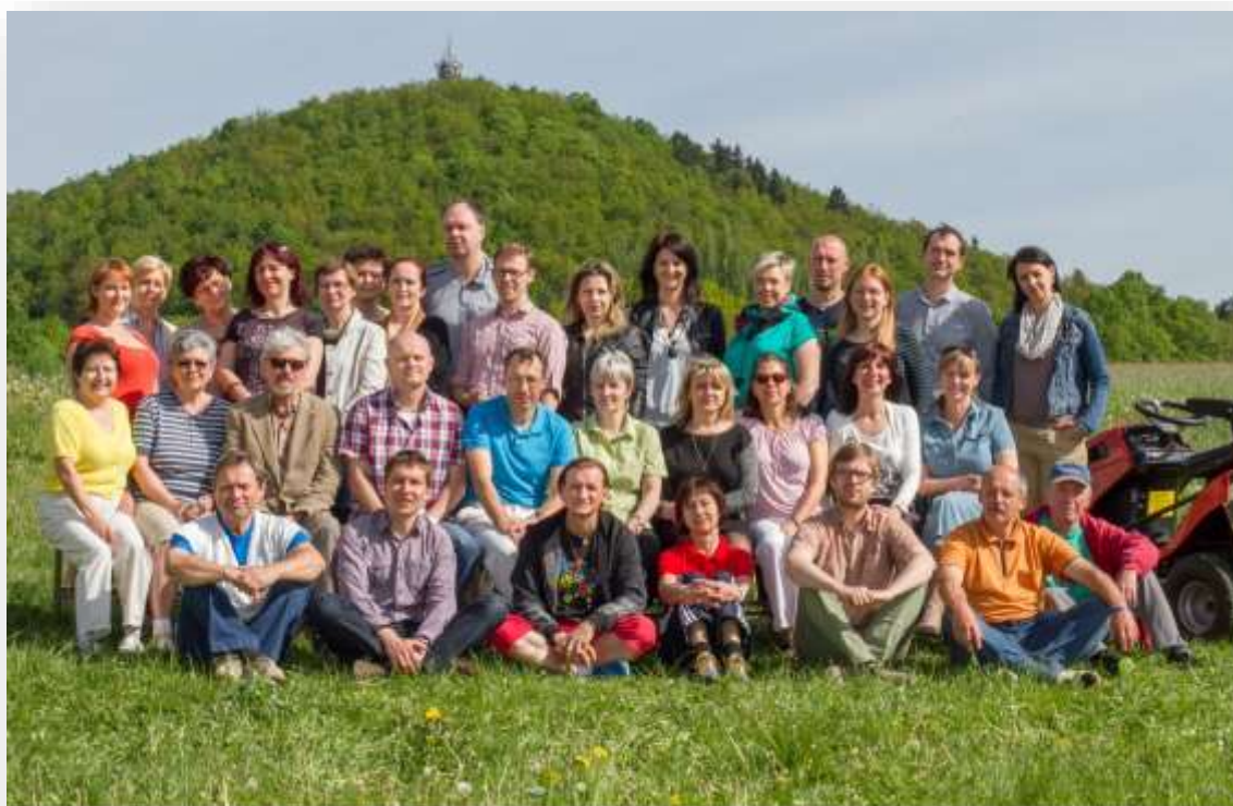
GYMNÁZIUM ČESKÁ LÍPA