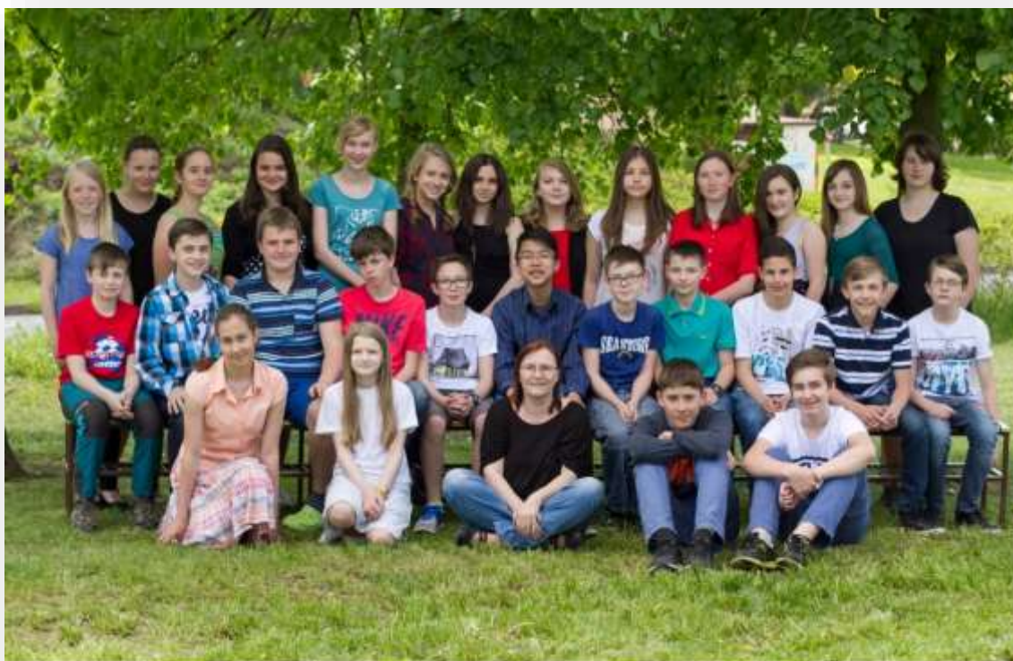
GYMNÁZIUM ČESKÁ LÍPA