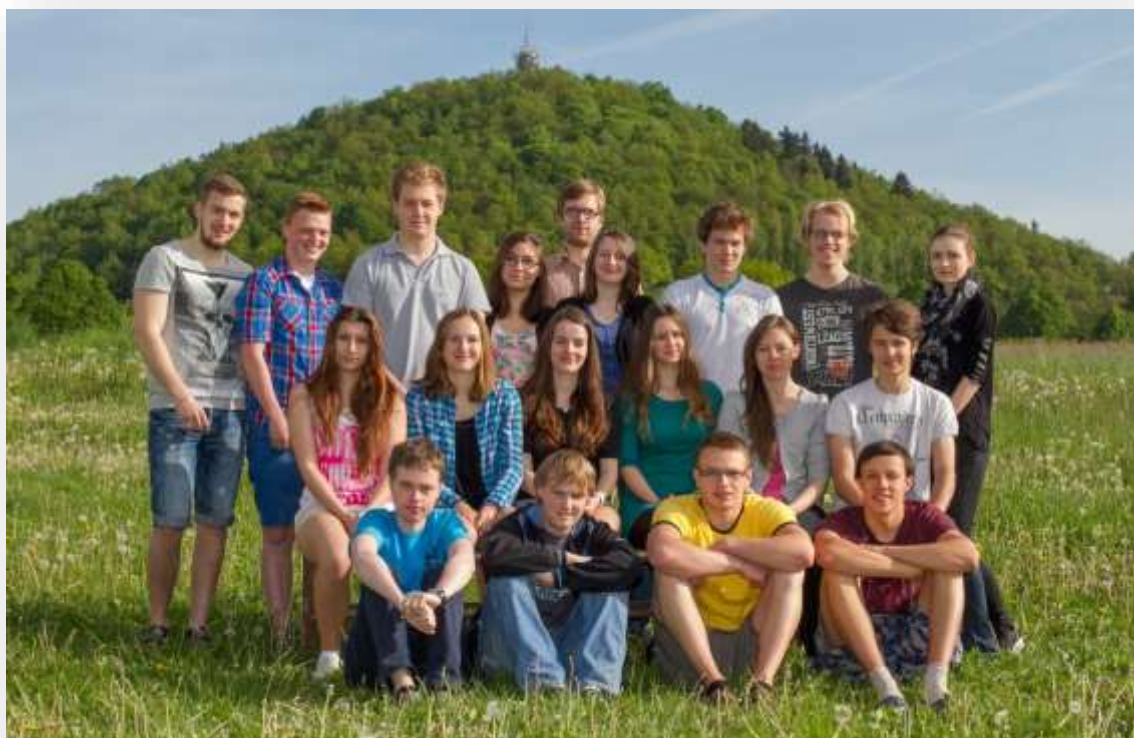
GYMNÁZIUM ČESKÁ LÍPA